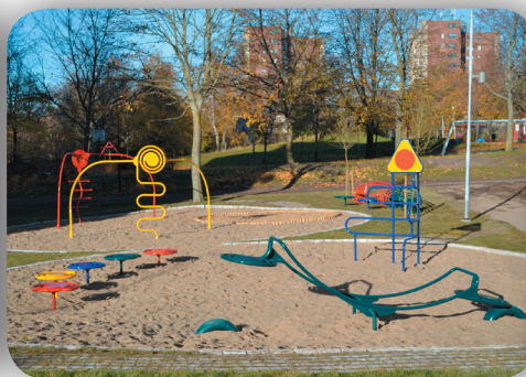
Projekt "SPIRELI" Vilo och lek område vid Fittja, Krogarevägen, Norsborg, beställare Botkyrkabyggen.