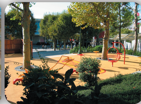
Projekt "Ellipse Spiraliqve de Versailles" vilo och lek område i Paris, Parc des Expositions, porte de Versailles beställare VIPARIS.