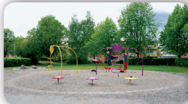
Projekt Lekområde vid Geneta Centrum, beställare Södertälje Kommun.